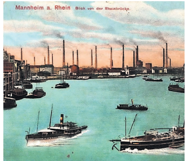
Historisches Dokument der Industrialisierung: Der Rhein bei Mannheim-Ludwigshafen im Jahr 1913.

Im Mittelpunkt stehen mehr als ein Dutzend Themen, die eine besondere Bedeutung für die Beziehung zwischen Städten und ländlichem Raum haben, wie etwa die Entwicklung der Bevölkerung seit dem Kaiserreich, die industrielle Entwicklung der drei Oberzentren