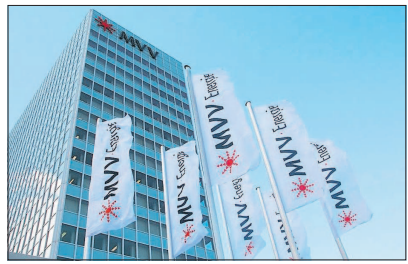
Das MVV-Gebäude am Neckar.

MVV Energie: Neue Ausschreibungsrunde läuft