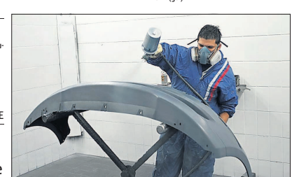
Fachmännisches Arbeiten in der MG Karosserie & Lack GmbH.

Info: MG Karosserie & Lack GmbH, Rheinkaistraße 54, 68159 Mannheim, Telefon: 0621 18004-0, Fax: 0621 18004-10, E-Mail: mgautolack@web.de . Öffnungszeiten: montags bis freitags 7.30 bis 17 sowie samstags 10 bis 14 Uhr. (gaj)